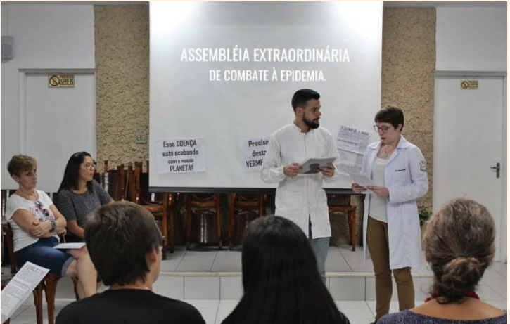
Dinâmica do Depto. de infância da USE SP, com base nas orientações de Kardec

a reflexão nas mentes infantis, é permitir que a doutrina espírita crie raízes nos campos da inteligência e do sentimento, deixando de ser letra morta para tornar-se força motora da transformação moral dos espíritos reencarnantes.