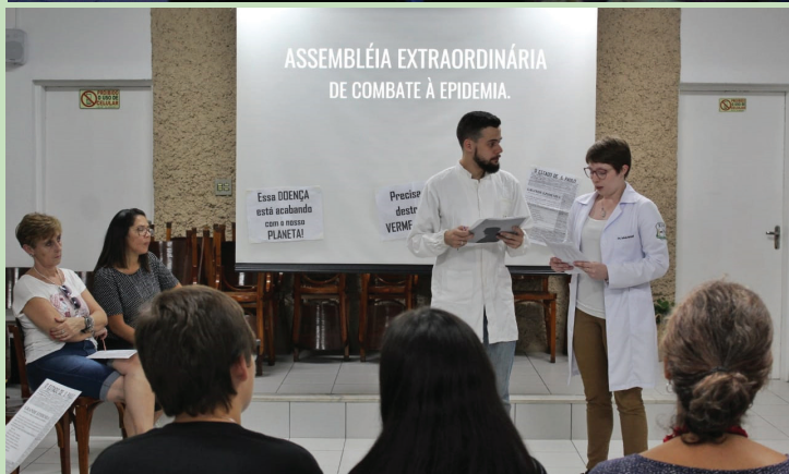
Dinâmica do Depto. de infância da USE SP, com base nas orientações de Kardec