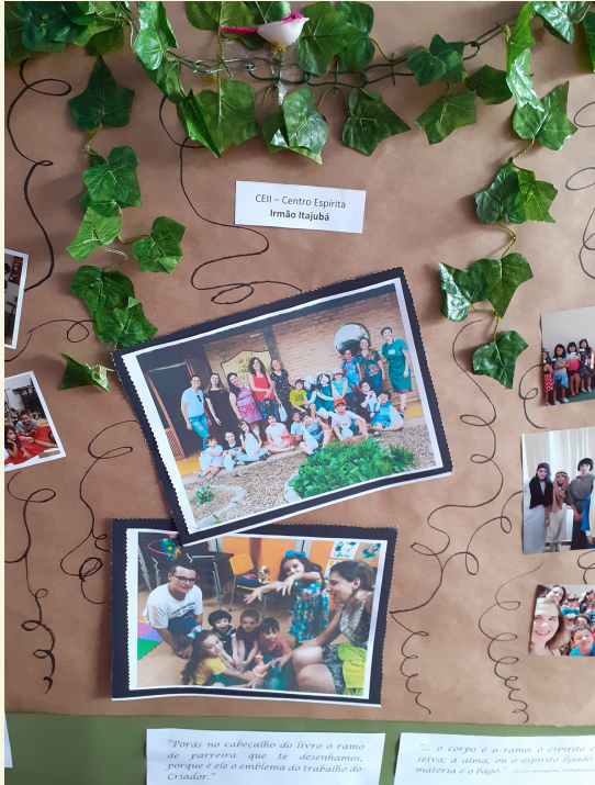
CEII - Centro Espírita Irmão Itajubá

"A satisfação que temos vendo a ... cujo valor total conhecerás, tal"