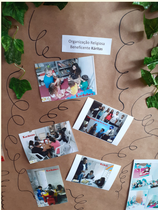
Organização Religiosa Beneficente Káritas