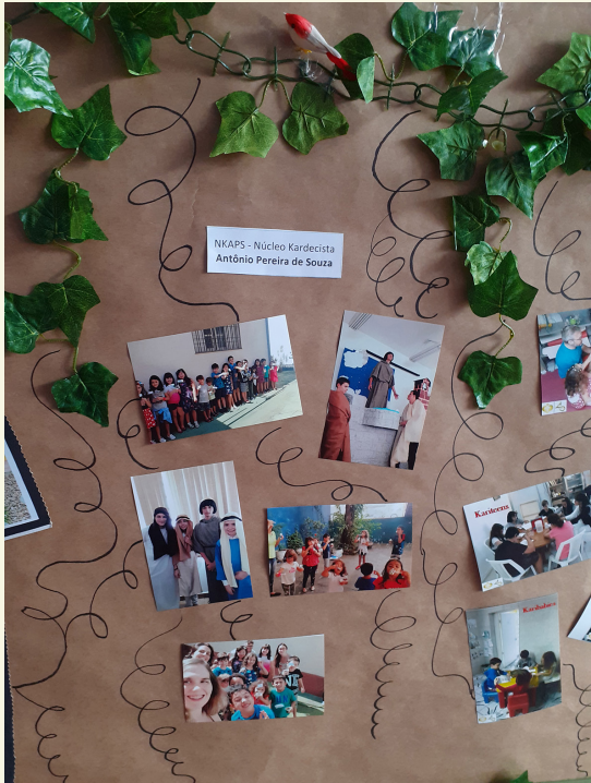
NKAPS - Núcleo Kardecista Antônio Pereira de Souza