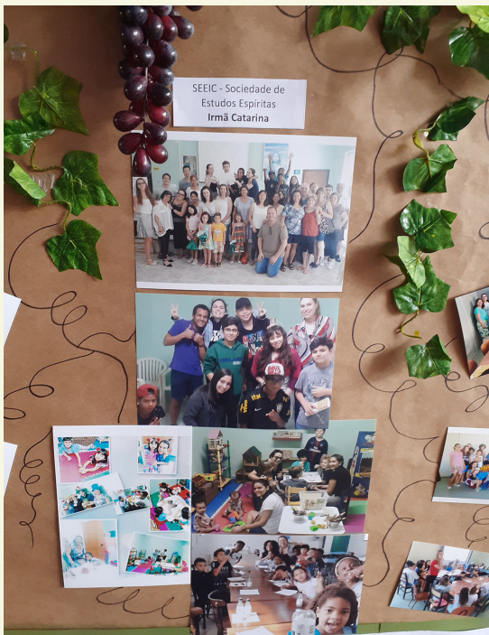
SEEIC - Sociedade de Estudos Espíritos Irmã Catarina

"A satisfação que temos vendo a ... cujo valor total conhecerás, tal"